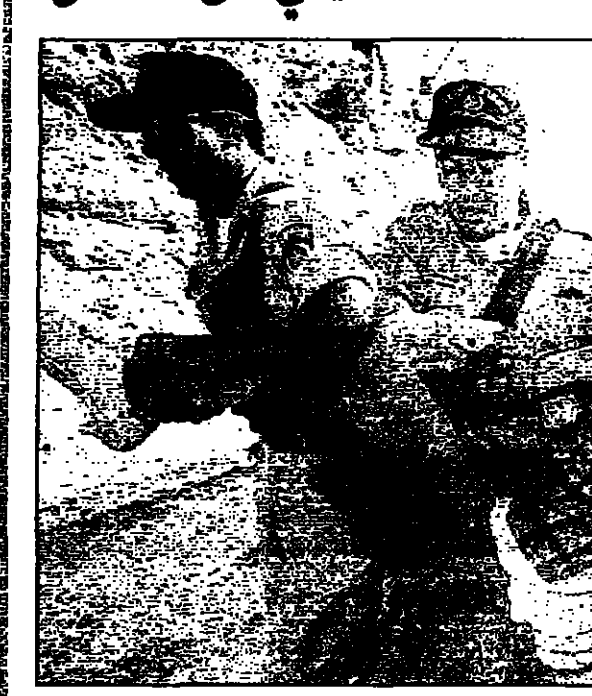
أربعة من قوات الشرطة يحملون فلسطينيا من عرب الجهايين خارج مستوطنة إسرائيلية

القدس - ف.ب.د. أعلنت مستوطنة مسؤول أن إسرائيل تعتزم طرد أكثر من 200 فلسطيني من سكان القدس بما فيهم عائلتان من عرب الجهايين الذين تم إجبارهم على التخلي عن منازلهم في القدس الشرقية الغربية.